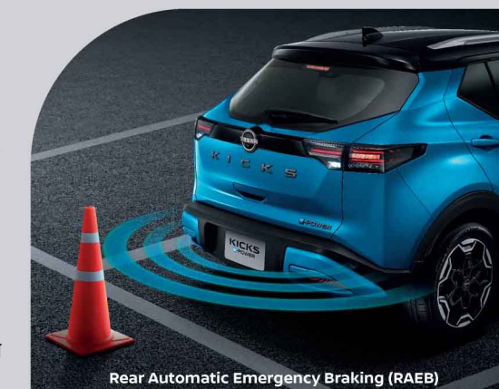
Rear Automatic Emergency Braking (RAEB)

มั่นใจได้ทุกครั้งที่คุณจอด ด้วยระบบเตือนขณะถอยรถ (RCTA) ที่ตรวจจับและช่วยเตือน เมื่อมีรถที่วิ่งข้ามด้านหลังเมื่อคุณเข้าเกียร์ถอย ช่วยเพิ่มความปลอดภัยแม้ในมุมอับสายตา และเสริมการป้องกันอีกชั้นด้วยระบบป้องกันการชนสำหรับด้านหลังรถ (RAEB) ที่ตรวจจับสิ่งกีดขวางด้านหลังรถ หากอยู่ในระยะเสียง พร้อมสัญญาณเตือน และช่วยชะลอหรือหยุดรถ เพื่อช่วยลดโอกาสการชน