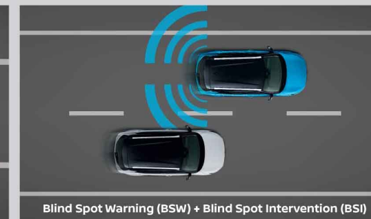
Blind Spot Warning (BSW) + Blind Spot Intervention (BSI)