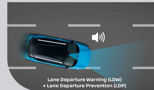
Lane Departure Warning (LDW) + Lane Departure Prevention (LDP)