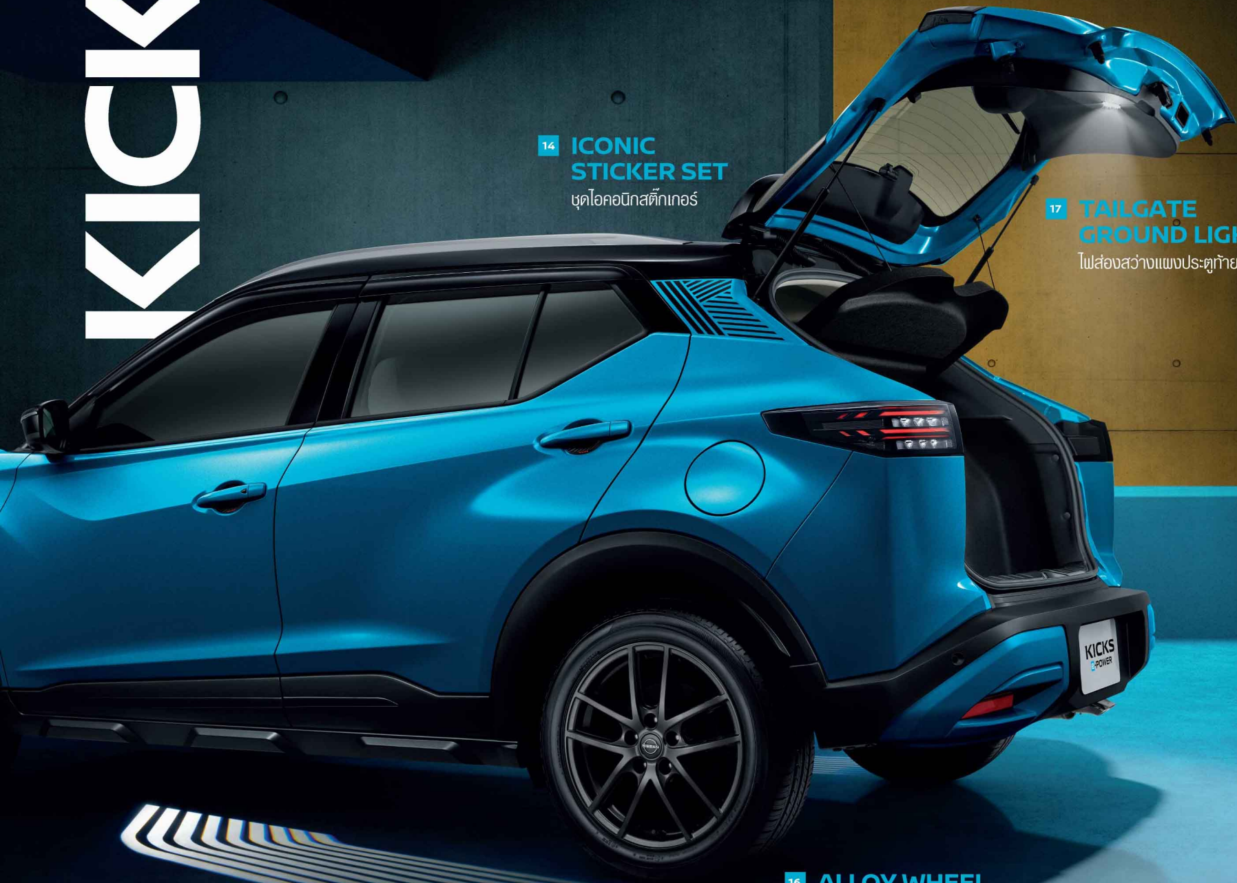
14 ICONIC STICKER SET ชุดไอคอนิกสติ๊กเกอร์