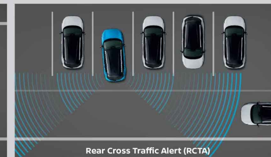
Rear Cross Traffic Alert (RCTA)