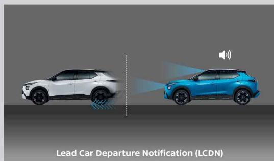
Lead Car Departure Notification (LCDN)

ไม่ว่าจะเส้นทางไหน NISSAN KICKS e-POWER ก็พร้อมดูแลคุณด้วยเทคโนโลยีความปลอดภัยรอบคัน 360° Safety Shield ที่ช่วยดูแลรอบคันให้คุณตลอดเวลา ทั้งด้านหน้า-ด้านข้าง-ด้านหลัง ทำให้ทุกกริปขับมันส์ขึ้น มันใจกว่าเดิม และพร้อมลุยทุกเส้นทางได้แบบไม่มีสะดุด