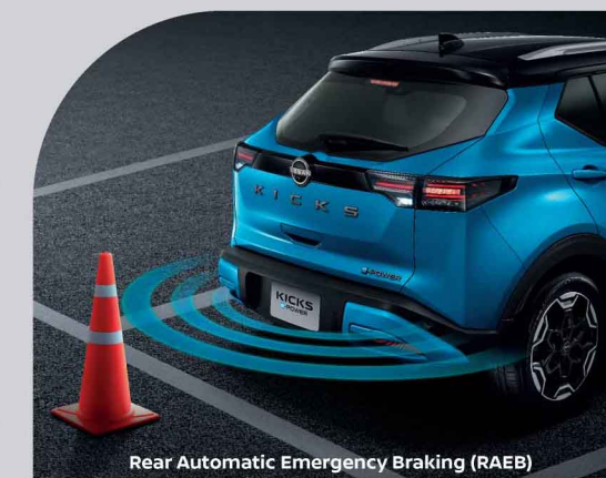
Rear Automatic Emergency Braking (RAEB)

มั่นใจได้ทุกครั้งที่คุณจอด ด้วยระบบเตือนขณะถอยรถ (RCTA) ที่ตรวจจับและช่วยเตือน เมื่อมีรถที่วิ่งข้ามด้านหลังเมื่อคุณเข้าเกียร์ถอย ช่วยเพิ่มความปลอดภัยแม้ในมุมอับสายตา และเสริมการป้องกันอีกชั้นด้วยระบบป้องกันการชนสำหรับด้านหลังรถ (RAEB) ที่ตรวจจับสิ่งกีดขวางด้านหลังรถ หากอยู่ในระยะเสียง พร้อมสัญญาณเตือน และช่วยชะลอหรือหยุดรถ เพื่อช่วยลดโอกาสการชน