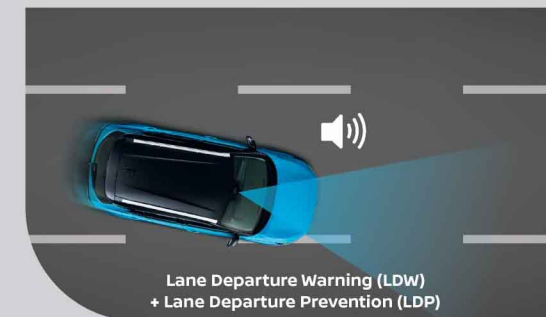
Lane Departure Warning (LDW) + Lane Departure Prevention (LDP)