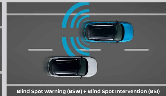
Blind Spot Warning (BSW) + Blind Spot Intervention (BSI)