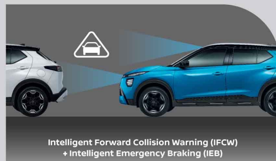
Intelligent Forward Collision Warning (IFCW) + Intelligent Emergency Braking (IEB)